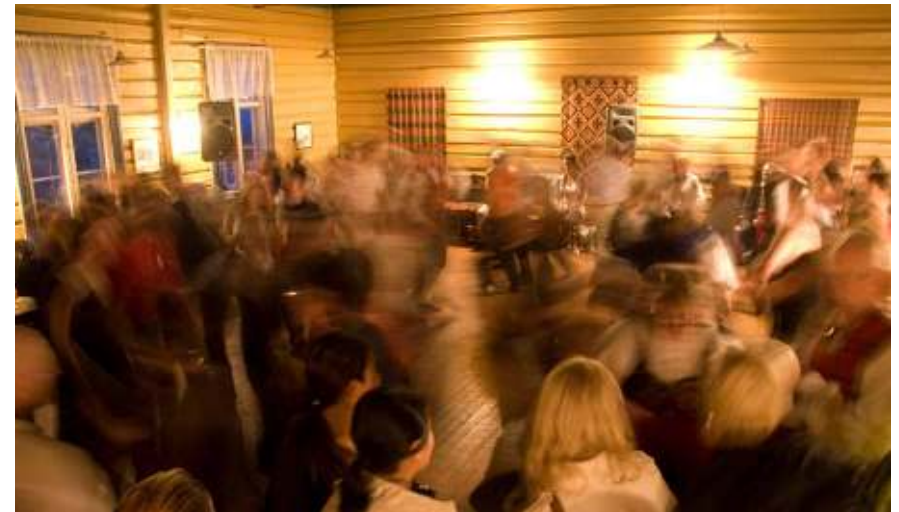
Tanz in Fagernes, Valdres

Anmeldungen und Informationen: luu@staff.uni-marburg.de